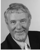
Alwin Brinkmann Oberbürgermeister der Stadt Emden

Sport kann eine wichtige Rolle für die Verbesserung des Lebens jedes Einzelnen spielen, ja nicht nur des Einzelnen, sondern von ganzen Gesellschaften.