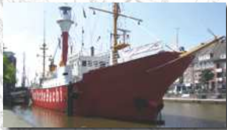
Feuerschiff Deutsche Bucht